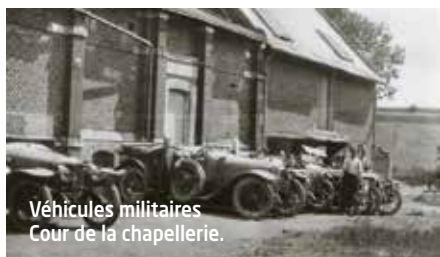
Véhicules militaires Cour de la chapellerie.

Si l'Est du département de la Somme était le front de batailles meurtrières, certains villages, à l'arrière, devenaient des secteurs où les soldats s'y reposaient et parfois réparaient leurs blessures dans les hôpitaux de campagne. Ils oubliaient, quelques temps, les horreurs des combats, les tranchées boueuses, le bruit des canons. Conty était un village animé par le passage de nombreux régiments d'infanterie et de quelques régiments de coloniaux. Des Indochinois ont séjourné à Conty, chargés de l'intendance auprès des officiers et sous officiers.