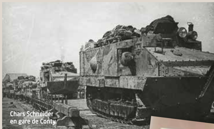
Chars Schneider en gare de Conty.