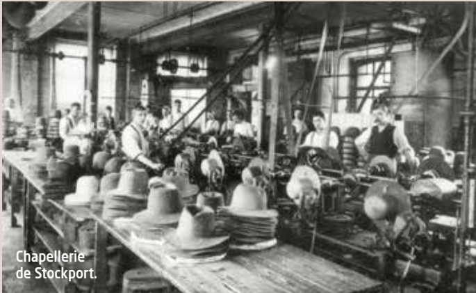
Chapperie de Stockport.