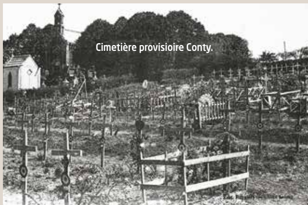
Cimetière provisoire Conty.